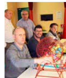
Quel sérieux !

Même si certains sont peu habitués à ce genre de festivité, venez quand même nombreux au loto 2019. On s'amuse beaucoup et les bénéfices de la soirée vont à l'école de foot du club. J.-C. D.